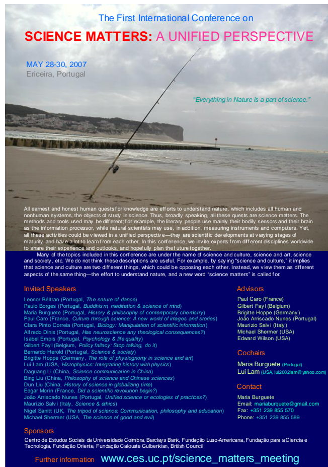
图 2 第一届 Scimat 国际会议海报